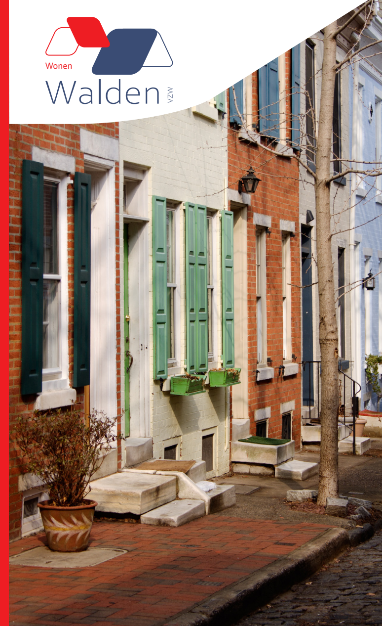
Verantwoordelijke uitgever: vzw Walden - Krijkelberg 1 - 3360 Bierbeek